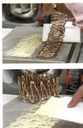
チョコレート スクレーパー