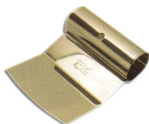
チョコレート グレーター (ステンレス製)