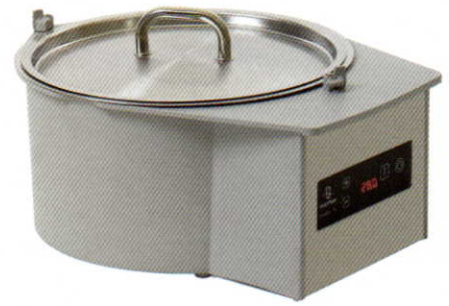
チョコレート ウォーマー 湯煎器