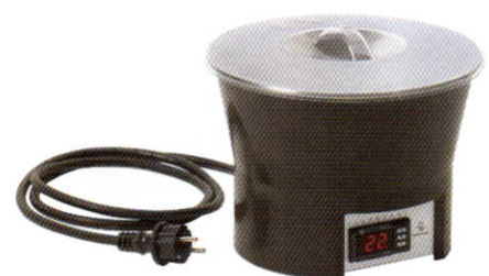
チョコレート ウォーマー 乾式