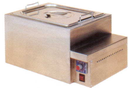
チョコレート ウォーマー 乾式