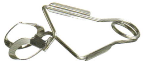
エスカルゴ tong (ステンレス製)