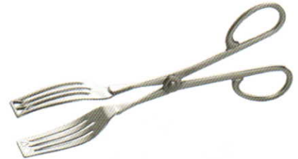
ケーキ・ tong (ステンレス製)