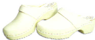
木靴 (合皮・プラスチック樹脂製)

水気に強く丈夫な素材で長持ちします。履き込み部分が深いので歩き易く、作業時に足が疲れません。