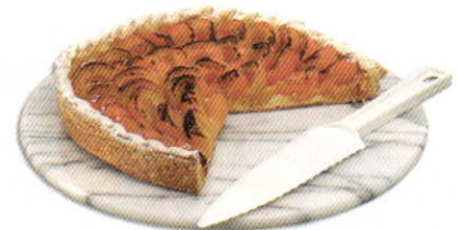
パイナイフ・サーバー クリア (ポリカーボネート製)