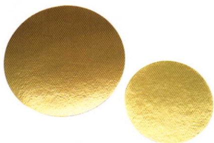
カルトン 1.5mm (100 枚単位)