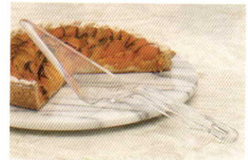
パイ・サーバー (ポリカーボネート製)