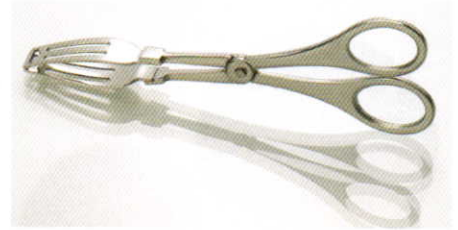
チョコレート・ tong (ステンレス製)