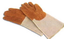
オーブングローブ 一対 耐熱: 300°C