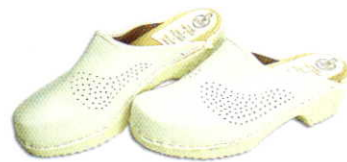
木靴 (合皮・プラスチック樹脂製)