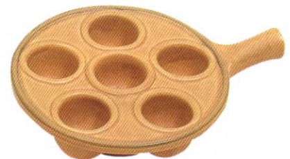
エスカルゴプレート (陶器)