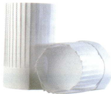
シェフトック 1 ケース 100 枚入 (10 × 10 袋) 額回りフリーサイズ

水気に強く丈夫な素材で長持ちします。履き込み部分が深いので歩き易く、作業時に足が疲れません。